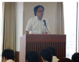
評価実務担当者に向けて の説明（鎌塚評価事業部 長・大阪会場）