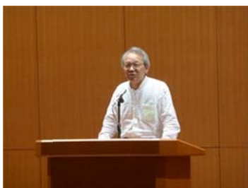
開会挨拶 （野上機構長・東京会場）

機構側より、「評価作業マニュアル」について、「第2期教育研究評価における評価作業の流れ」などとあわせて説明があった後、評価実務担当者との間で質疑応答が行われました。