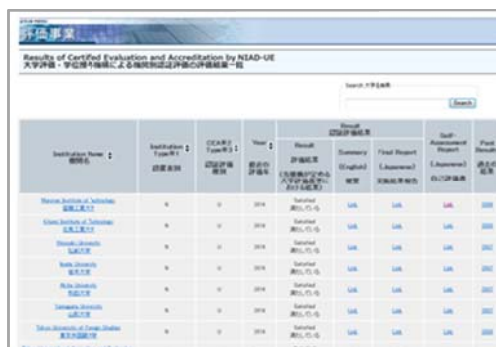
「大学評価・学位授与機構による機関別認証評価の評価結果一覧」の表示画面

また、検索やソート機能を備え、機関名称や受審年度での検索を可能としました。また、海外からの閲覧も可能となるよう、日本語・英語の2か国語併記としています。