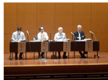
質疑応答（東京会場）