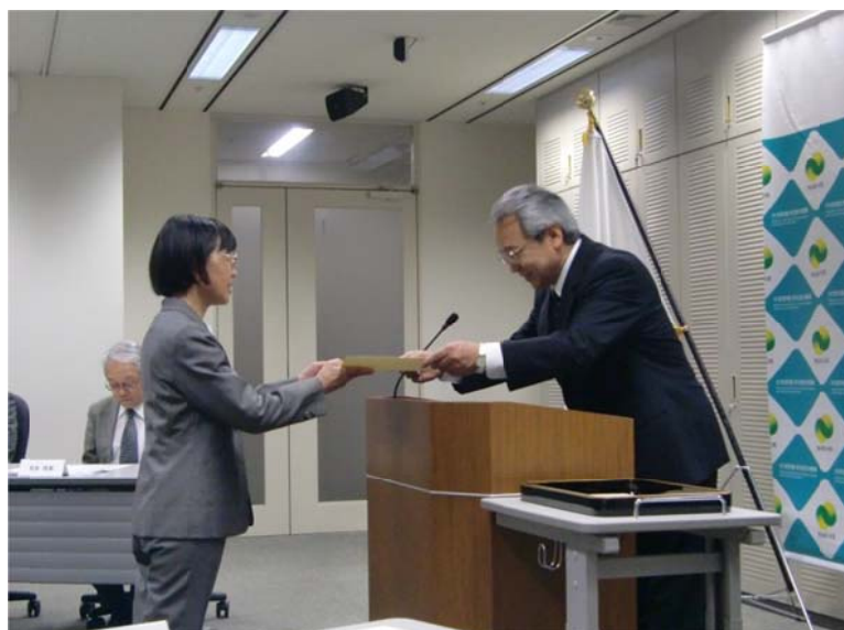
平成 26 年度学位記伝達式の様子

伝達式では、各関係者列席のもと、各大学校の代表者へ学位記が伝達され、野上機構長から「当機構としても、学位の国際的な通用性が担保されるよう引き続き努めるとともに、学位を授与された方々の今後の活躍を祈念したい」との挨拶により伝達式はしめくられました。また、伝達式終了後、独立行政法人水産大学校、国立看護大学校及び防衛大学校との懇談会が行われ、機構長、理事、研究開発部の教員との意見交換が行われました。