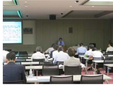
説明会・研修会の様子